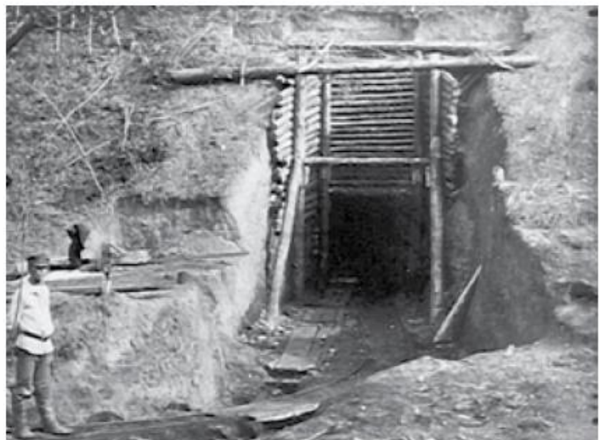
Устье горизонтальной штольни 15-го пласта Верхне-Палкаштинской линии в районе Осиновки, 1926 год

ИЗ МЕТАЛЛА, ВЫПЛАВЛЕННОГО В ГОДЫ ВОЙНЫ НА ОСИНИКОВСКОМ УГЛЕ, МОЖНО БЫЛО СДЕЛАТЬ 40 ТЫСЯЧ ТАНКОВ, 45 000 САМОЛЕТОВ И БОЛЕЕ 100 МИЛЛИОНОВ СНАРЯДОВ