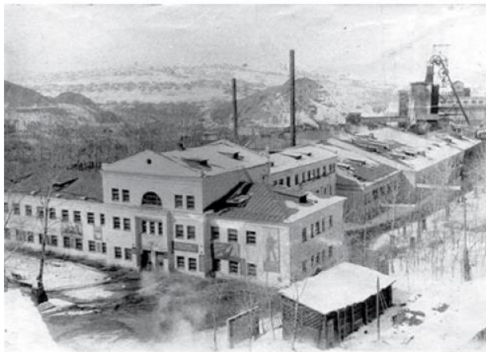
АБК шахты «Капитальная-1»