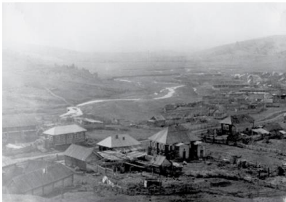
Общий вид деревни Осиновка, 1926 год.

Так была решена судьба Осиновского рудника, призванного целиком и полностью снабжать коксующимися углями первенца сибирской металлургии — КМК.